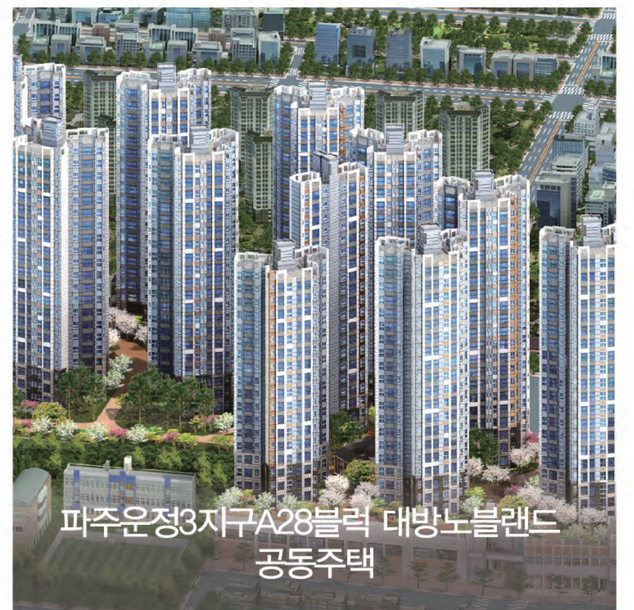
파주운정3지구A28블럭 대방노블랜드 공동주택