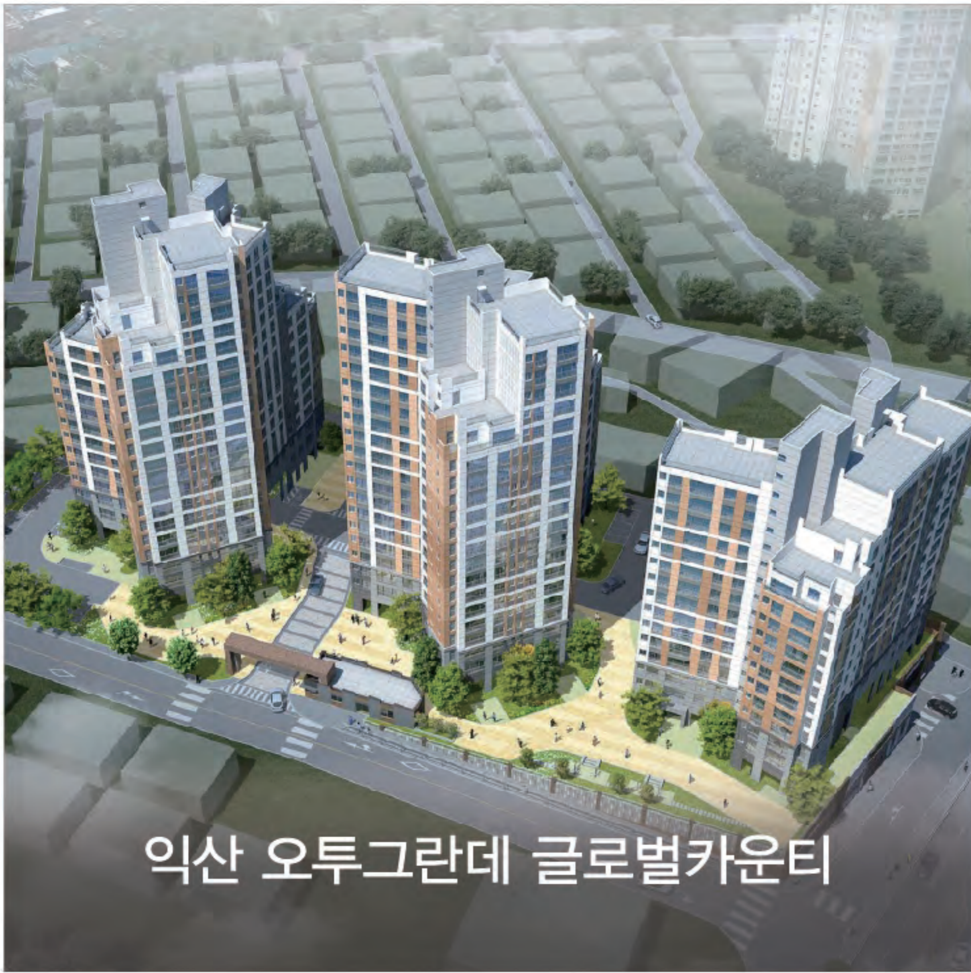
익산 오투그란데 글로벌카운티