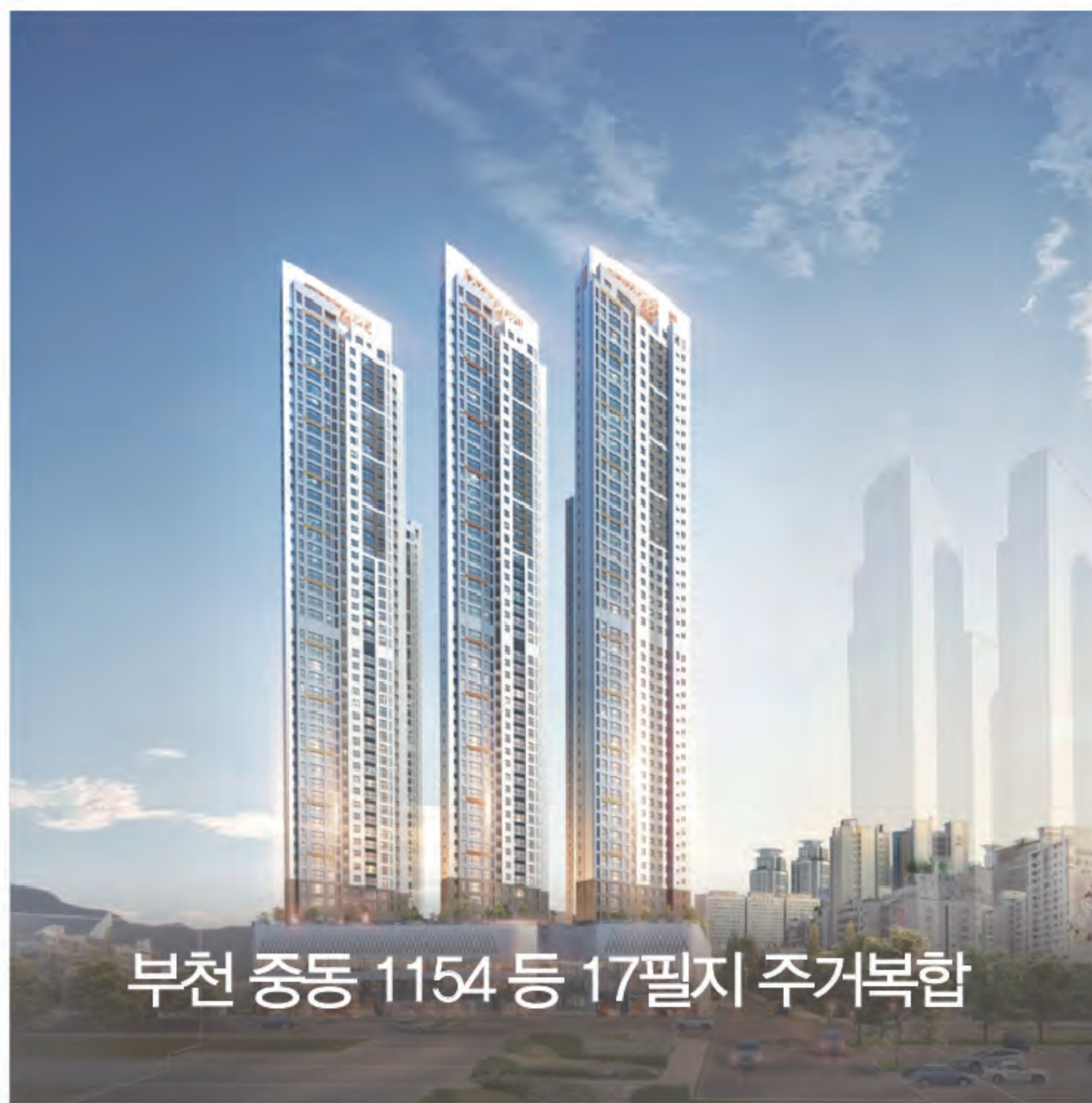
부천 중동 1154 등 17필지 주거복합