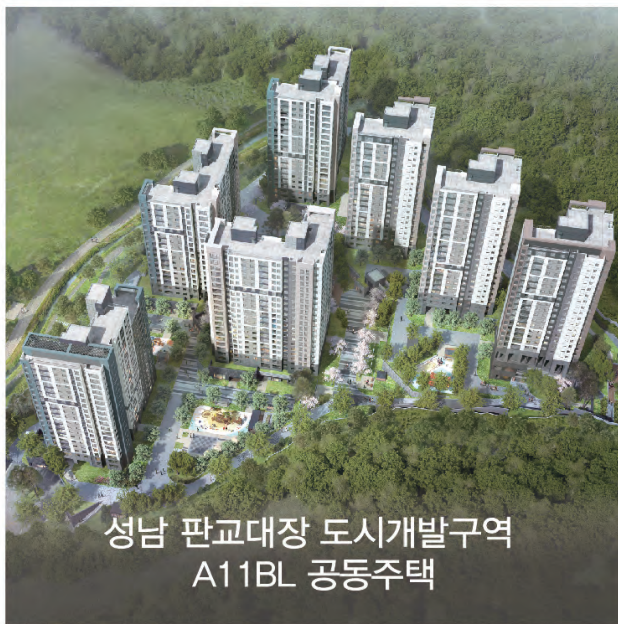
성남 판교대장 도시개발구역 A11BL 공동주택