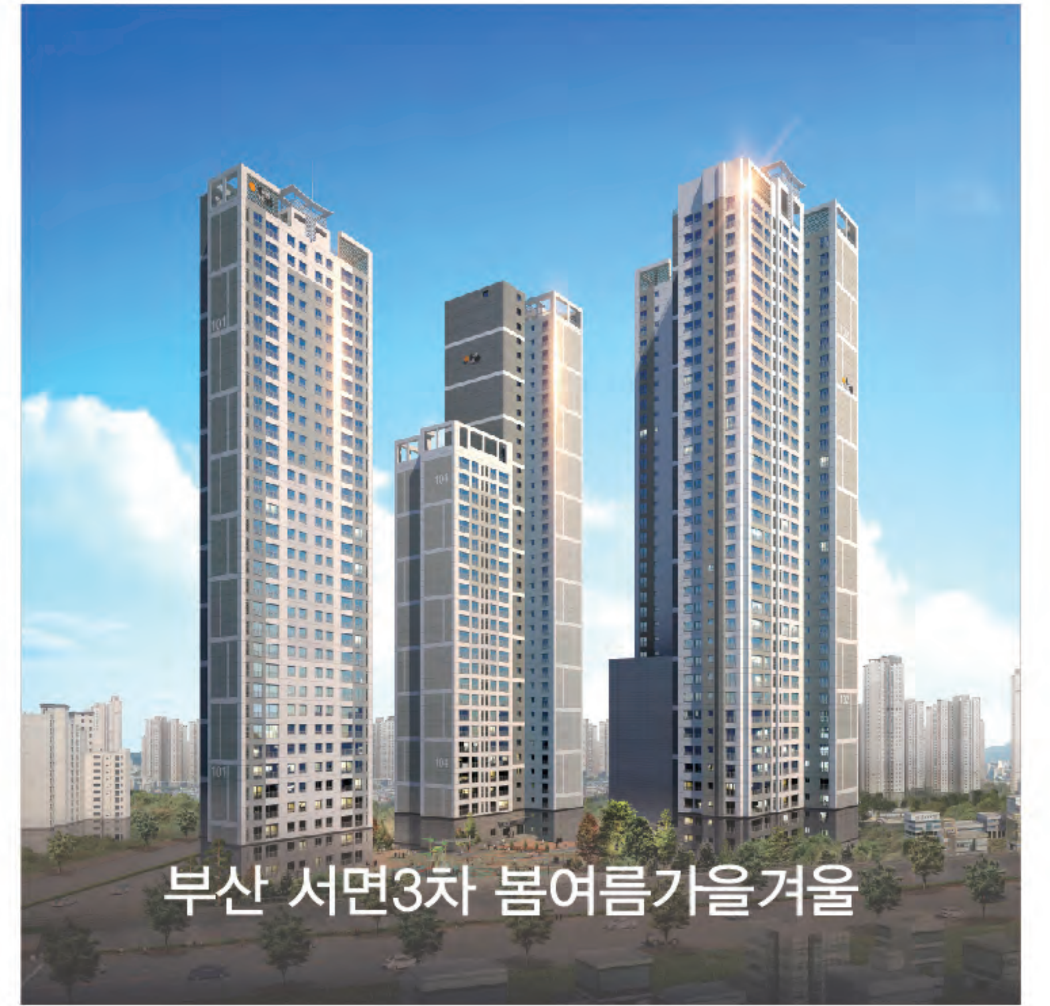
부산 서면3차 봄여름가을겨울