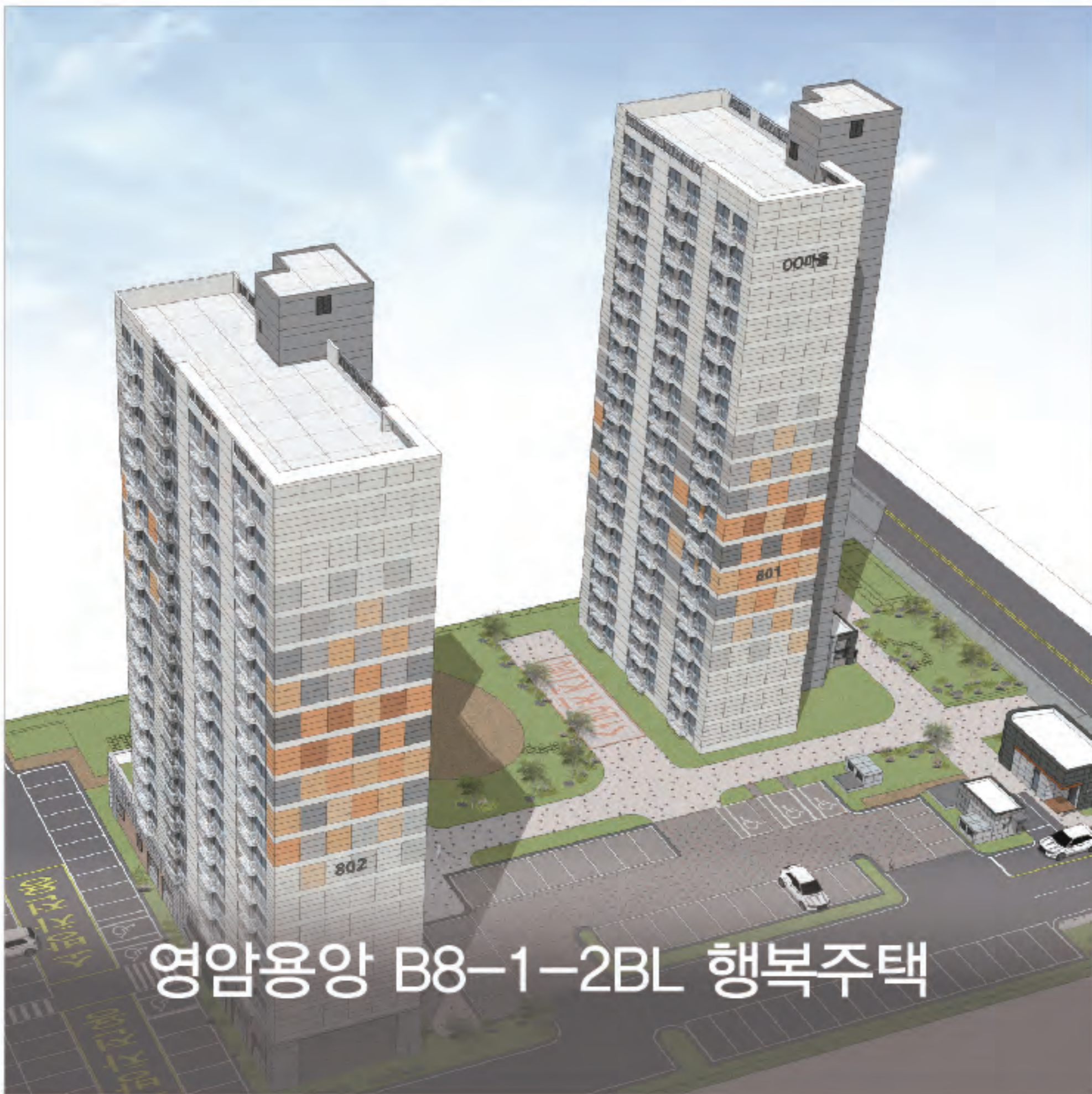
영암용양 B8-1-2BL 행복주택