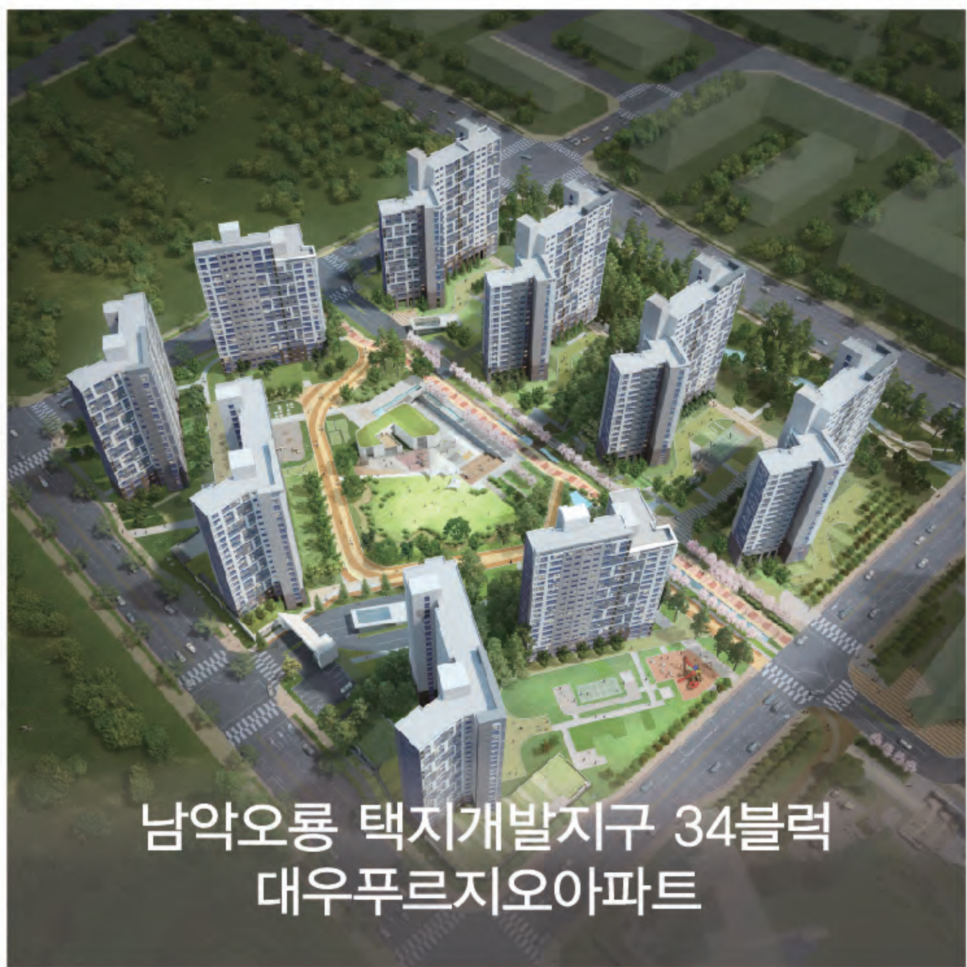
남악오룡 택지개발지구 34블럭 대우푸르지오아파트