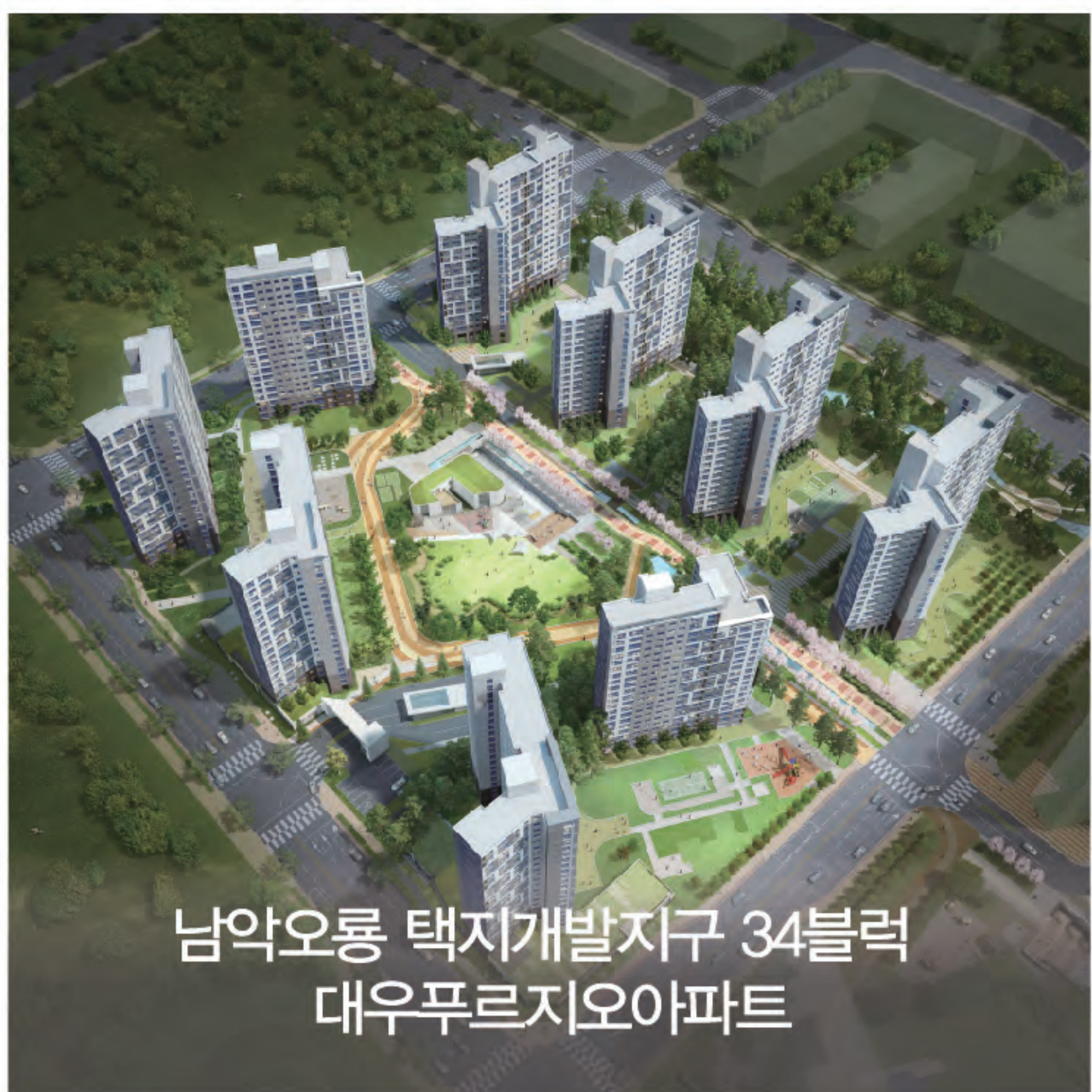
남악오룡 택지개발지구 34블럭 대우푸르지오아파트