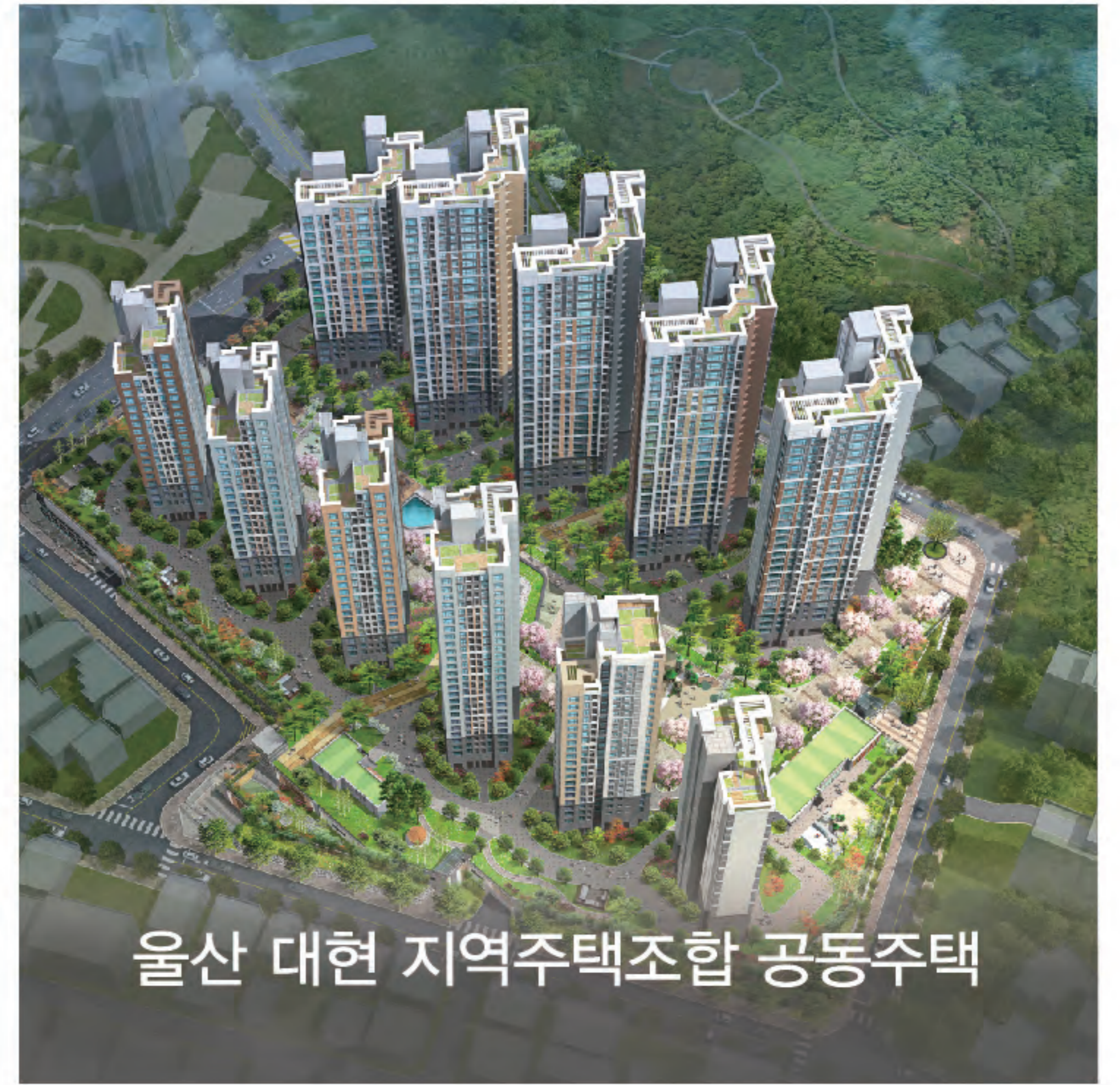
울산 대현 지역주택조합 공동주택