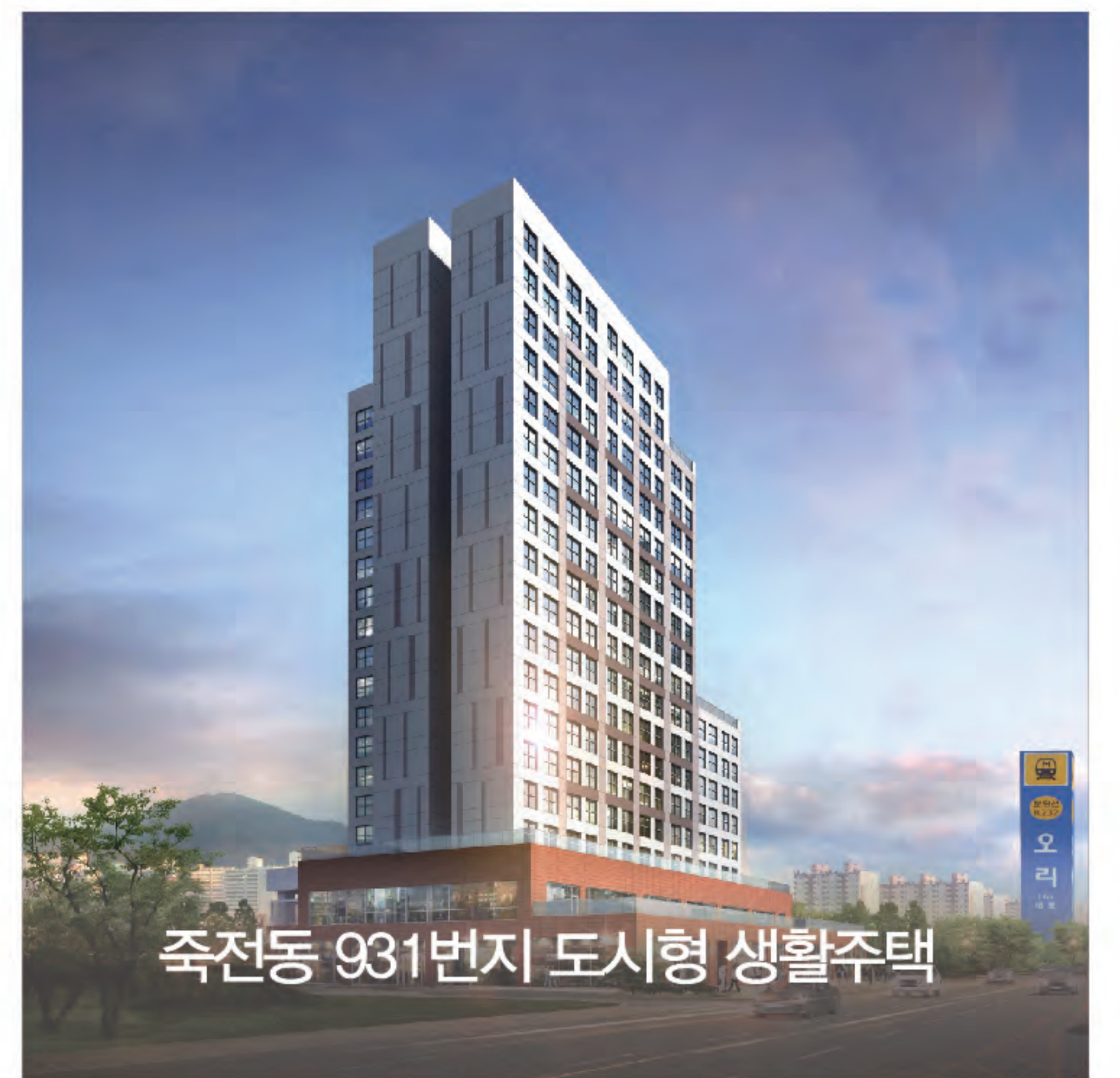
죽전동 931번지 도시형 생활주택