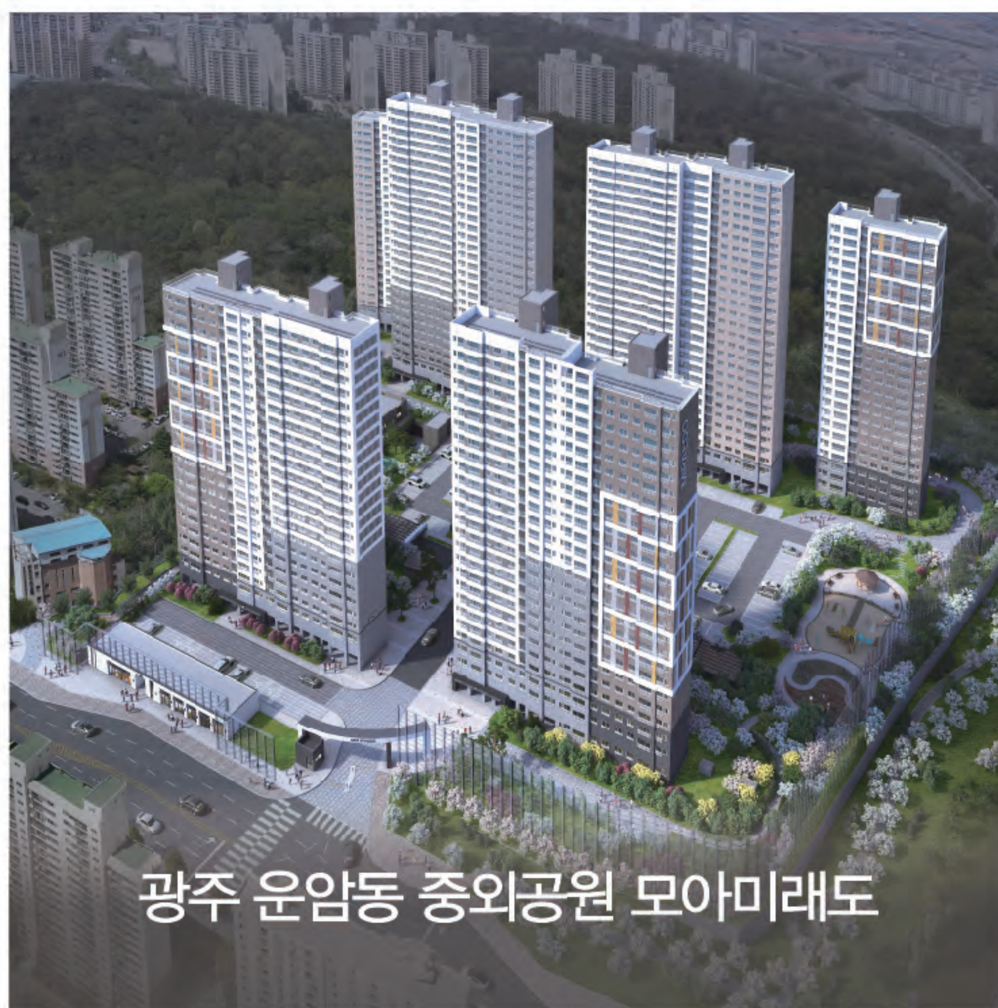
광주 운암동 중외공원 모아미래도