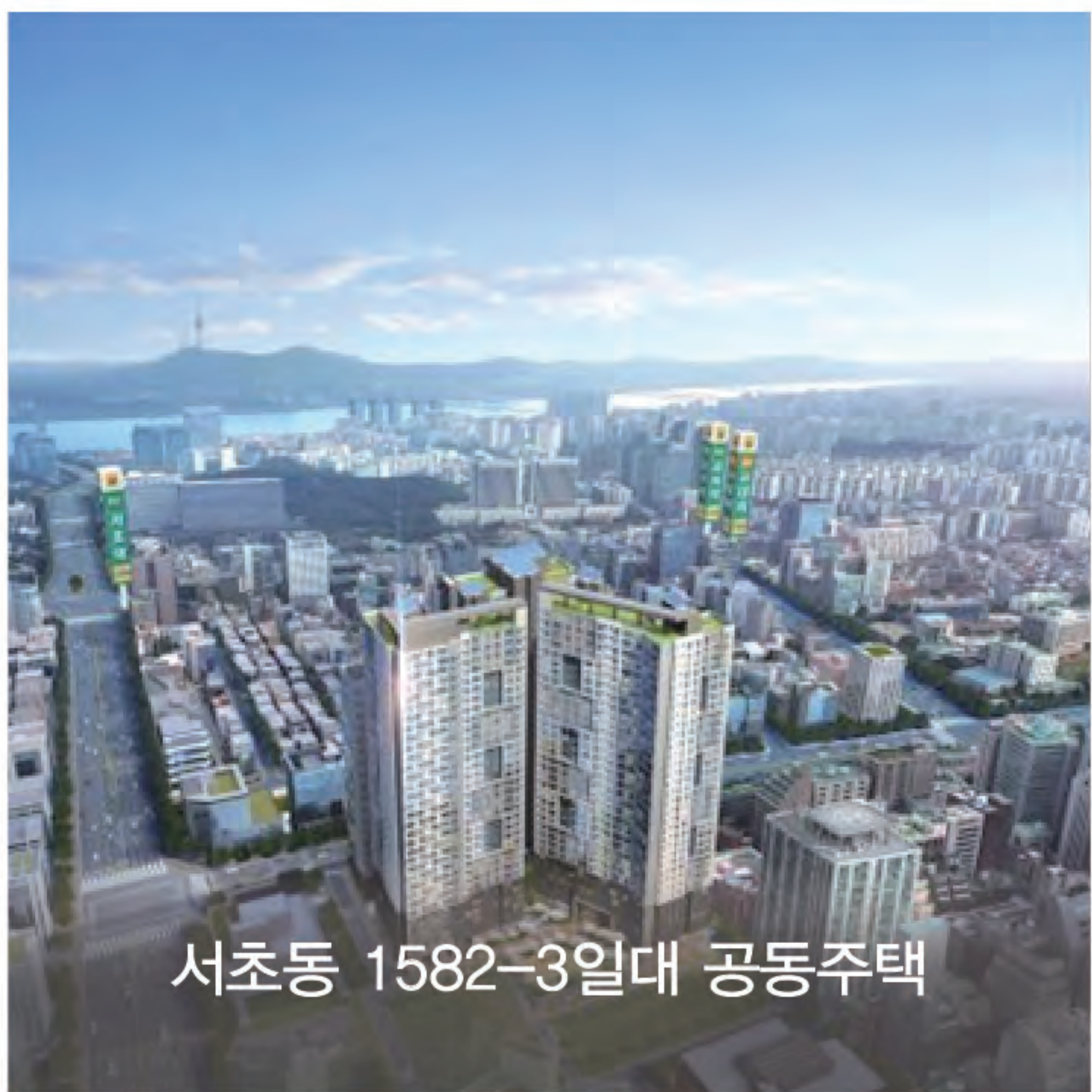
서초동 1582-3일대 공동주택