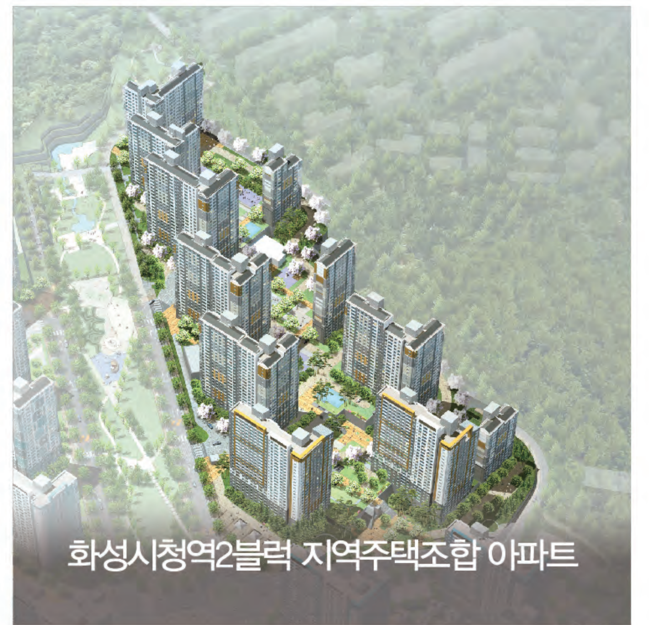
화성시청역2블럭 지역주택조합 아파트