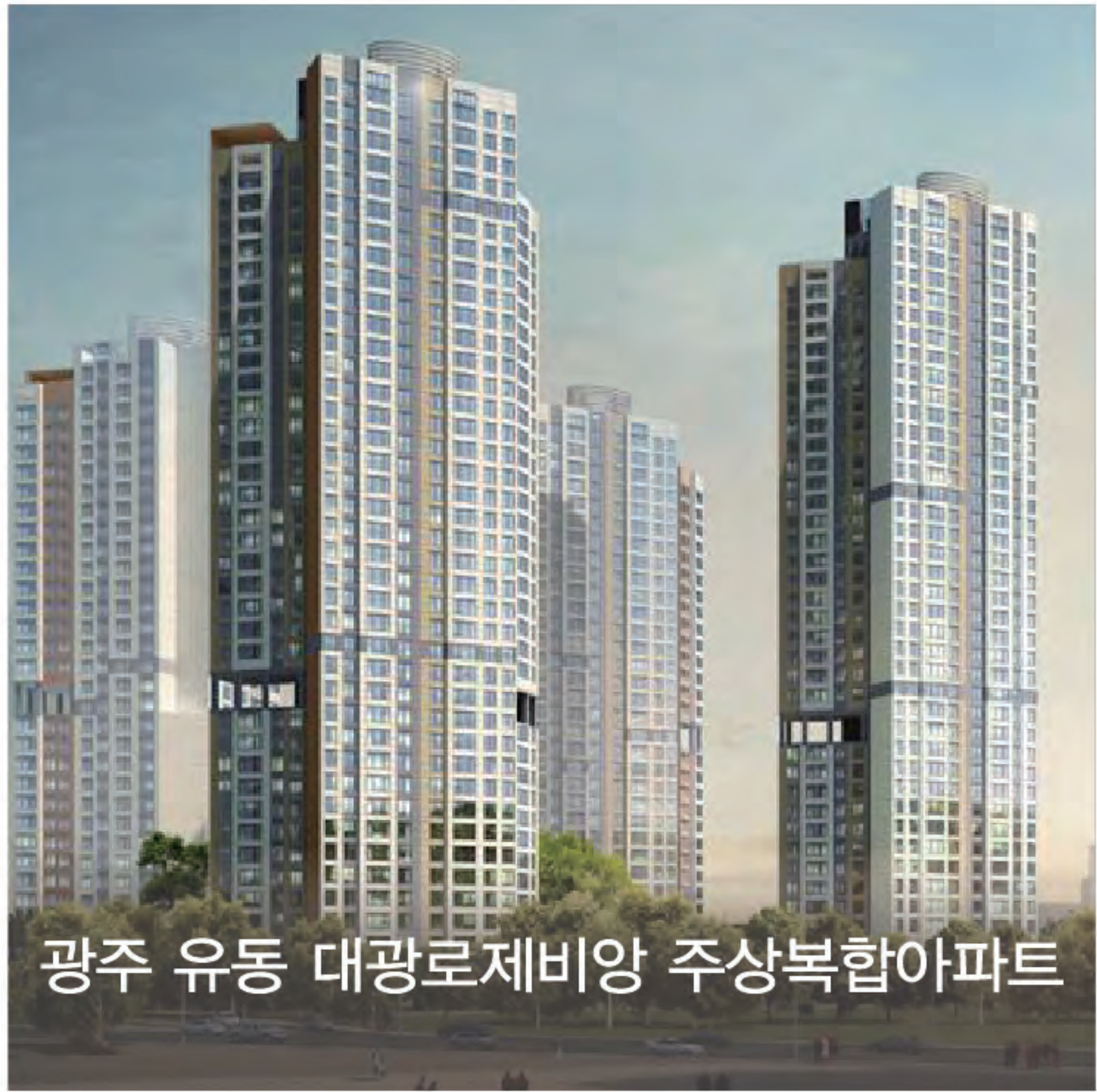
광주 유동 대광로제비앙 주상복합아파트