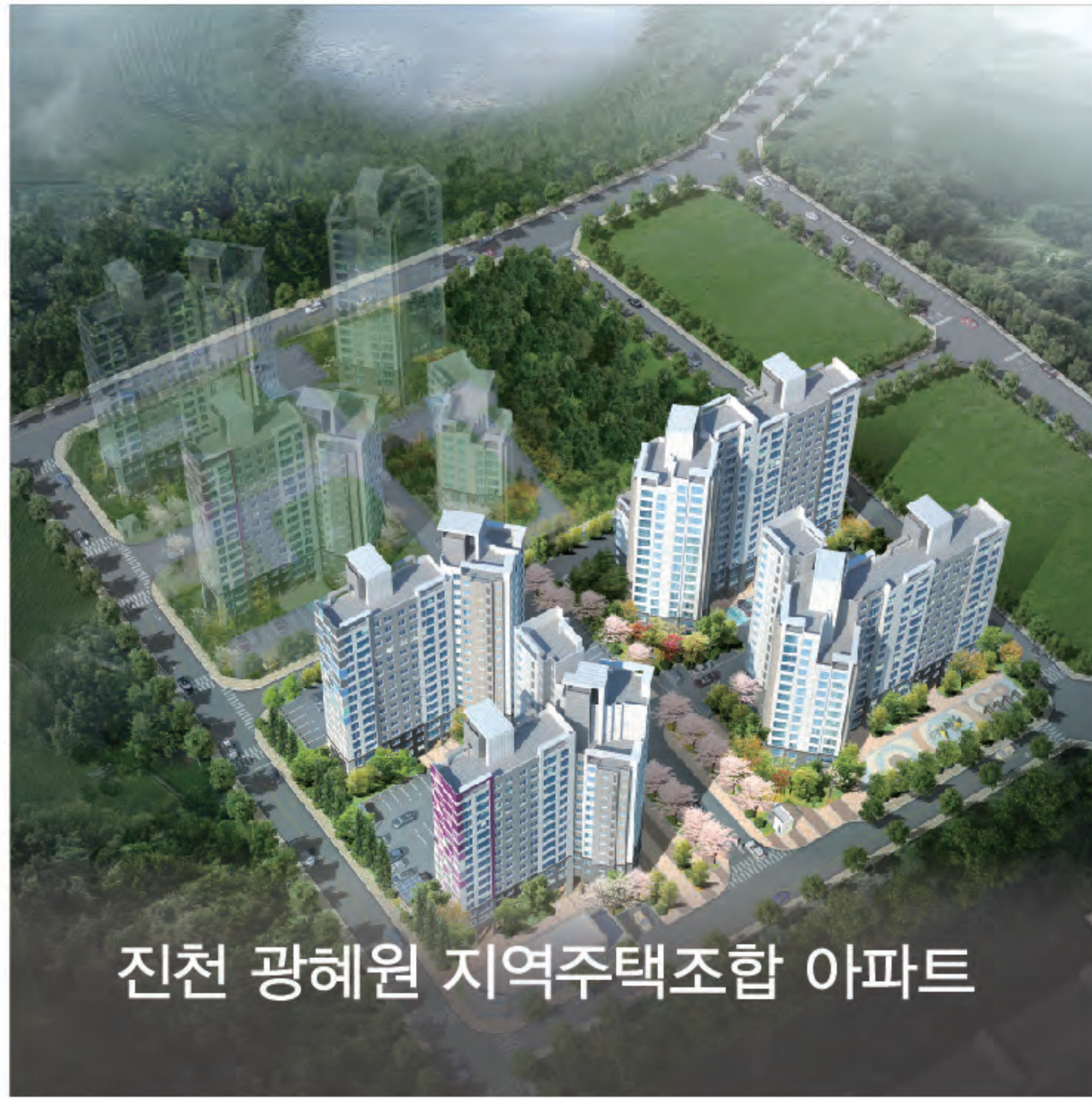
진천 광혜원 지역주택조합 아파트